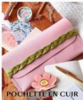
POCHETTE EN CUIR

2020: UNE ANNÉE TOUT EN DOUCEUR TRICOTS D'HIVER, LIN ET FICELLE, APPLIQUÉ, RÉCUP', ART NOUVEAU