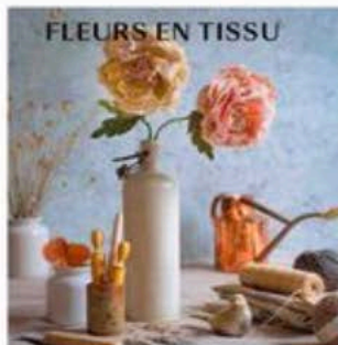
FLEURS EN TISSU